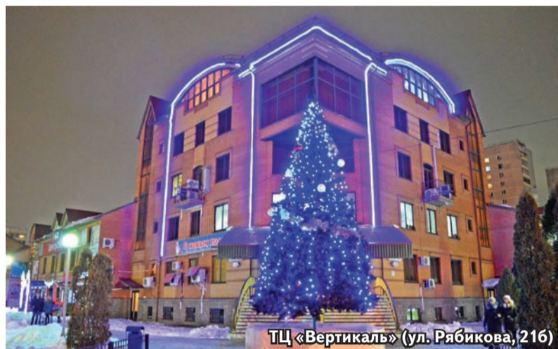
ТЦ «Вертикаль» (ул. Рябикова, 216)

Мы продолжаем рассказывать о подготовке нашего города к Новому году и Рождеству. В этом номере мы подробнее остановимся на праздничном оформлении крупнейшего района Ульяновска - Засвияжья.