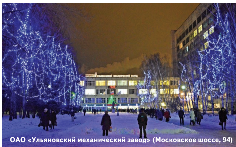
ОАО «Ульяновский механический завод» (Московское шоссе, 94)

Мы продолжаем рассказывать о подготовке нашего города к Новому году и Рождеству. В этом номере мы подробнее остановимся на праздничном оформлении крупнейшего района Ульяновска - Засвияжья.